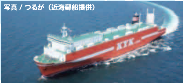
写真 / つるが (近海郵船提供)