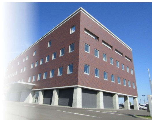
苫小牧港管理組合庁舎